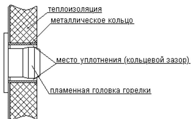
Рис.3. Фрагмент фронтальной крышки котла (уплотнение зазора между крышкой и пламенной головкой).