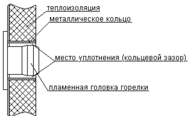
Рис. 3. Фрагмент фронтальной крышки котла (уплотнение зазора между крышкой и пламенной головкой).